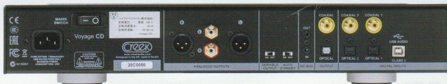
デジタルコントロールセンター としても機能する

然な音色で、高音弦楽器のボウイングになめらかさや艶やかさを感じられる。またトウツティの迫力がリアルに蘇り、ティンパニーのシヨット