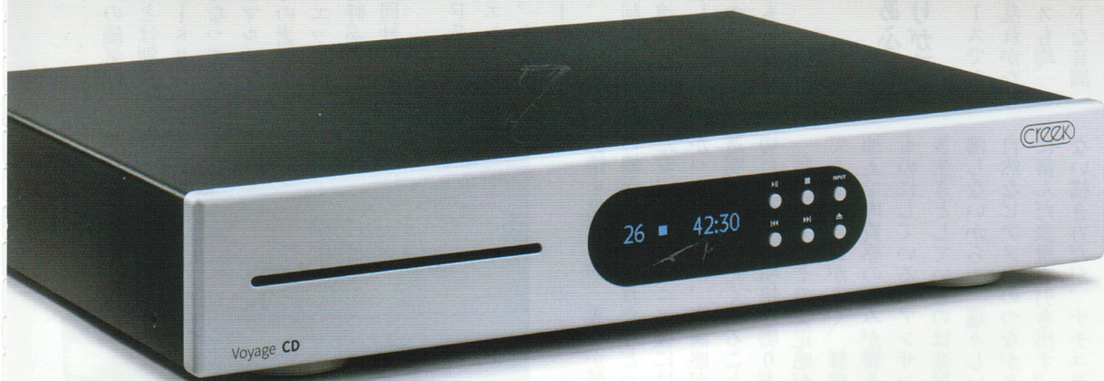
スロットインメカを採用した シンプルなフォルムも魅力